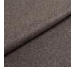
Wooly 1042 grafit 1038807