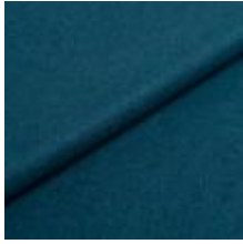
Wooly 2279 Ocean 1039022