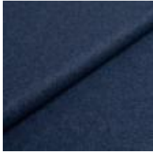
Wooly 2019 marine 1038802