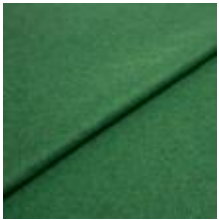
Wooly 2302 Court 1039027