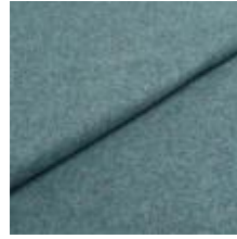
Wooly 2288 Soda 1039024