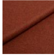
Wooly 380037 Rust 1039025