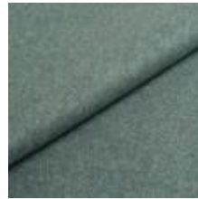
Wooly 228881 Lapis 1039030