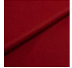
Wooly 2301 Marsala 1039026