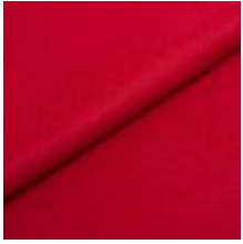
Wooly 2142 raspberry 1038801