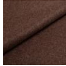
Wooly 1008 brown 1038806