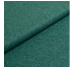
Wooly 842287 Lagoon 1039032