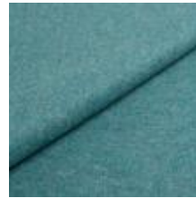
Wooly 22882287 Aquamarin 1039031