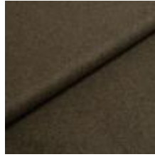
Wooly 1011 bottle green 1038803