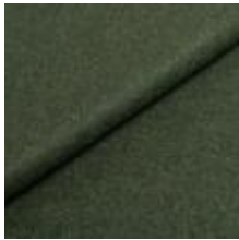
Wooly 840069 Juniper 1039028