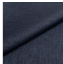
Lido trend 104 Night 1017507