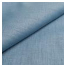
Lido trend 103 Sky 1017506