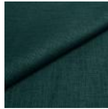
Lido trend 137 Wave 1017549