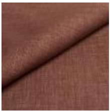
Lido trend 82 Grape 1017528