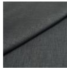
Lido trend 100 Lagoon 1017502