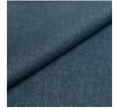
Lido trend 102 Pacific 1017521