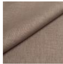
Lido trend 130 Pelican 1017532