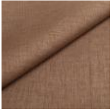
Lido trend 71 Desert 1017516