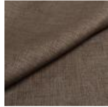
Lido trend 128 Typhoon 1017555