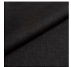
Lido trend 106 Midnight 1017503