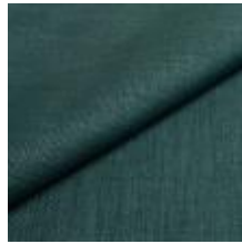
Lido trend 138 Pool 1017548