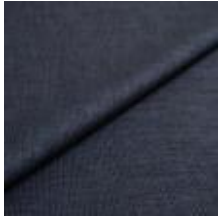
Lido trend 136 Power blue 1017552