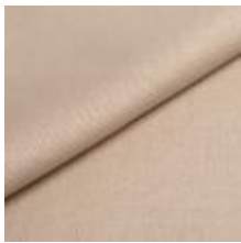
Lido trend 161 Soft sand 1017529