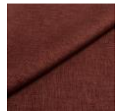
Lido trend 145 Nocturne 1017545