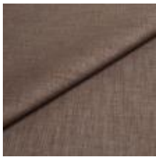
Lido 68 Dust 1017181