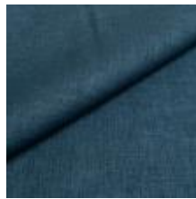
Lido 121 blue 1017183