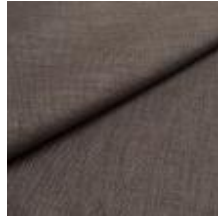
Lido trend 129 Savile grey 1017554