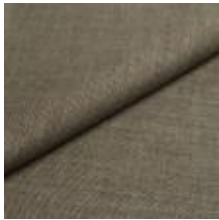
Lido trend 95 Mineral 1017523