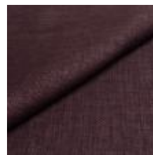
Lido trend 144 Thistle 1017544