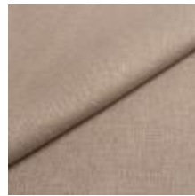
Lido trend 131 Quartz 1017531