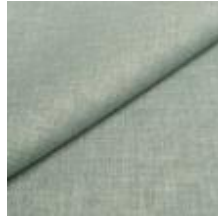
Lido trend 98 Glass 1017512