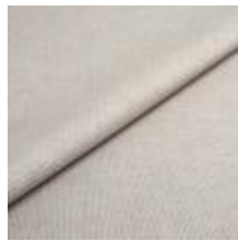
Lido trend 132 Toned 1017530