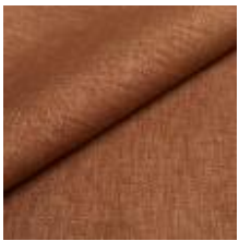
Lido trend 156 Onion 1017534