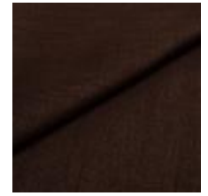
Lido 6 coffee 1017106