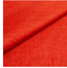
Lido trend 81 Orange 1017514