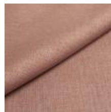
Lido trend 148 Orchid 1017543