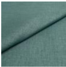
Lido 42 soda 1017142