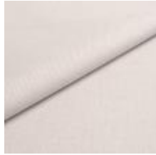
Lido trend 133 Ice white 1017553