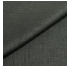
Lido trend 142 Gale 1017550