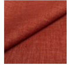
Lido trend 85 Rust 1017515