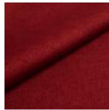
Lido trend 84 Brick 1017501