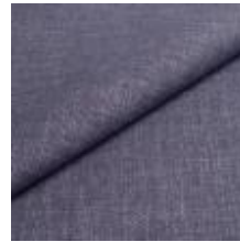
Lido trend 92 Indigo 1017526