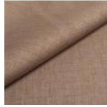
Lido trend 70 Linen 1017519