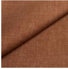
Lido trend 72 Latte 1017511