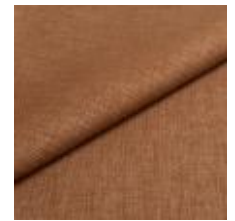
Lido trend 157 Fudge 1017533