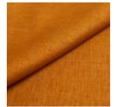
Lido trend 154 Mustard 1017539