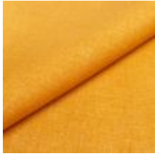
Lido trend 80 Curry 1017517