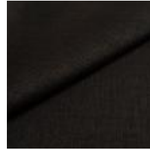
Lido trend 126 Onyx 1017556