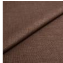
Lido trend 76 Havana 1017525