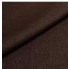
Lido 46 mole 1017146