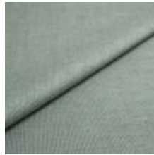
Lido trend 93 Aqua 1017524