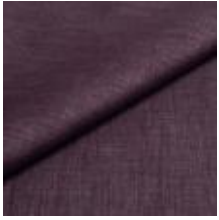
Lido trend 91 Purpur 1017510