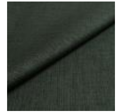
Lido trend 140 Storm 1017551