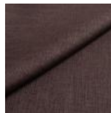
Lido trend 78 Stone 1017508