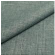
Lido trend 99 Crystal 1017522