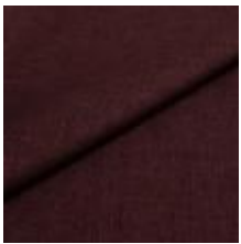
Lido 71 plum 1017171