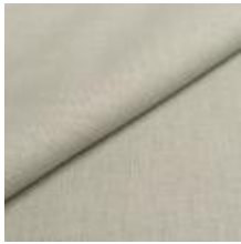
Lido trend 143 Mint 1017546