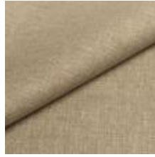
Lido trend 96 Bright green 1017518