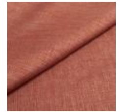
Lido trend 88 Terra 1017527