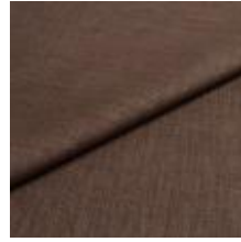
Lido trend 75 Fog 1017513