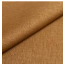
Lido trend 155 Lemongrass 1017536