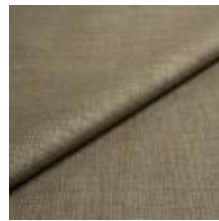
Lido trend 134 Antique green 1017537