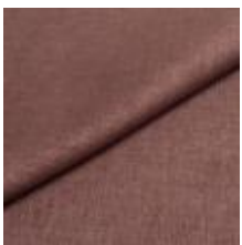
Lido trend 89 Heather 1017504