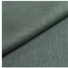
Lido trend 141 Cyan 1017547