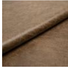
Rodeo 26 Desert 1028626