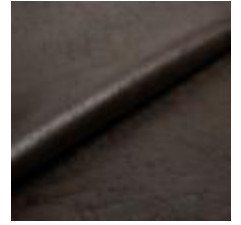
Rodeo 46 Tobacco 1028646