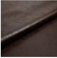
Rodeo 6 Java 1028606