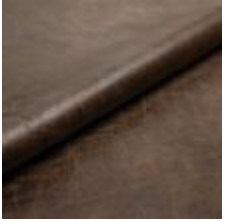
Rodeo 66 Umbra 1028666