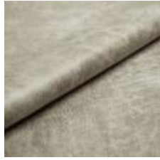
Rodeo 10 Ebony 1028610