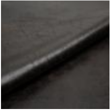
Rodeo 4 Night 1028604