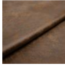
Rodeo 36 Cognac 1028636